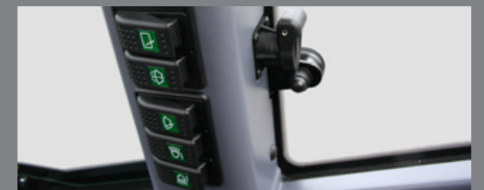
Jungiklių juosta, elektros kištukas