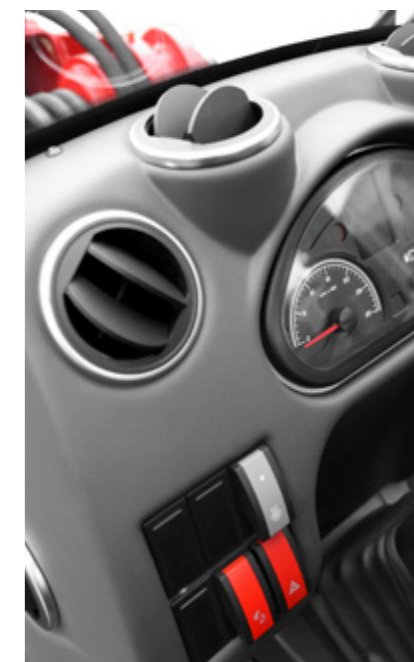
Papildomos, didesnės oro angos, užtikrinančios neprikaištingą oro cirkuliaciją ir optimalų jungiklių diapazoną