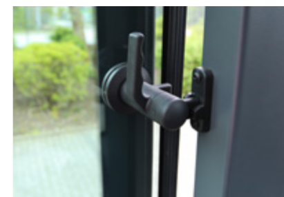
Pakeliami šoniniai uždengimai