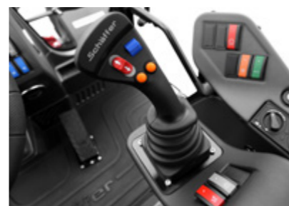
Nauja vairasvirtė su išplėstomis funkcijomis