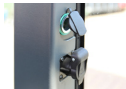
12 voltų lizdas mobiliems įrenginiams įkrauti / 3 kontaktų įrenginio lizdas