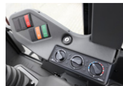
Naujas prietaisų skydelis, kuriame lengva pasiekti uždegimo jungiklį, šildymo valdiklius ir papildomą oro kondicionavimo sistemą